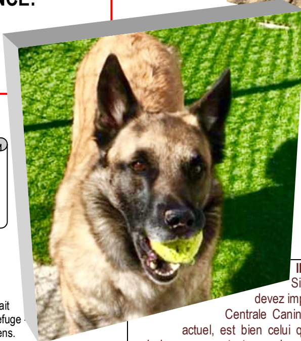
DAISY, 6 ans 1/2

Ce sont nos Chiens "Top Priorités" - Il y a URGENCE (Retrouvez les page 2).