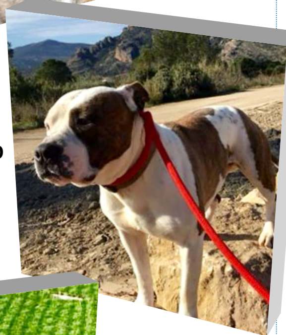
MAESTRO 4 ans,