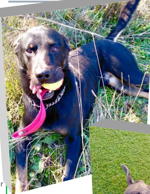
TYLER, 6 ans