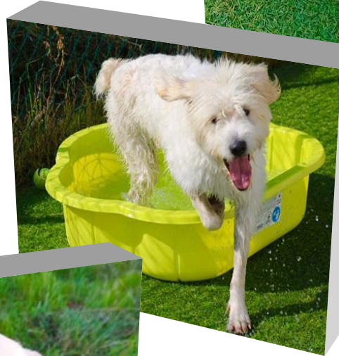
SOHO, 2 ans