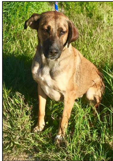
ALPHA 2 ans 1/2