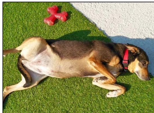
SANTA 11 ans

Ce sont nos Chiens "Top Priorités" - Il y a URGENCE (Retrouvez les page 2).