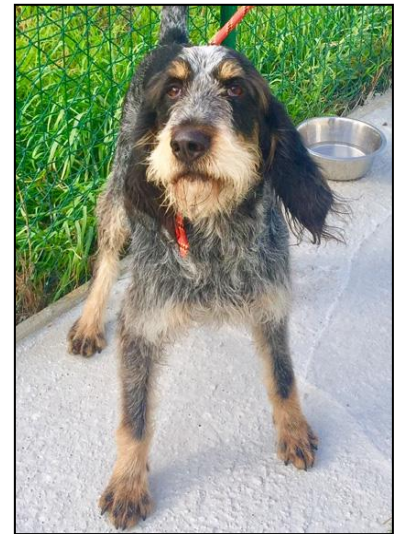
HAWAI 3 ans 1/2