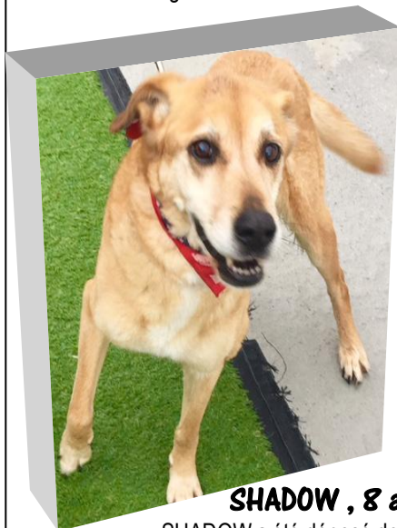
SHADOW , 8 ans

SHADOW a été déposé de nuit devant la grille du Refuge, lui aussi dans le box de dépose-minute. D'après ce que nous avons pu en apprendre, cet abandon anonyme serait consécutif à un divorce. SHADOW est né en janvier 2010 ; il est très gentil et très sociable.