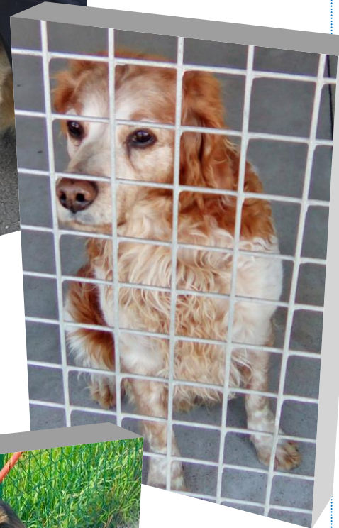
DAISY a 5 ans